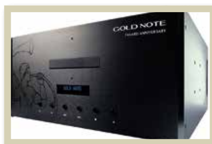
FAVARD ANNIVERSARY CD