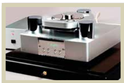
CEC TLO 3.0 CD