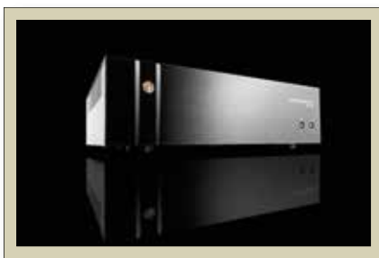
PA-1175 POWER AMPLIFIER